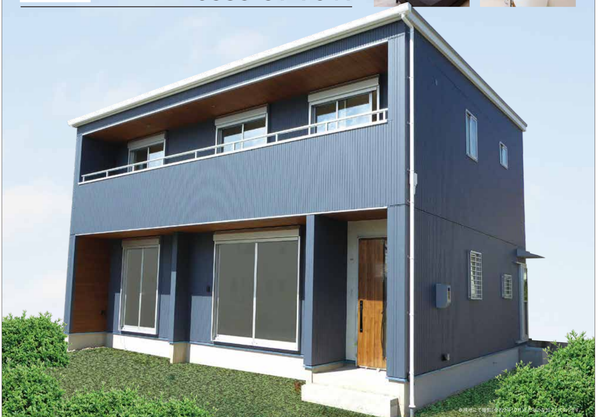
※現地にて撮影(令和2年10月)したものを加工しております。